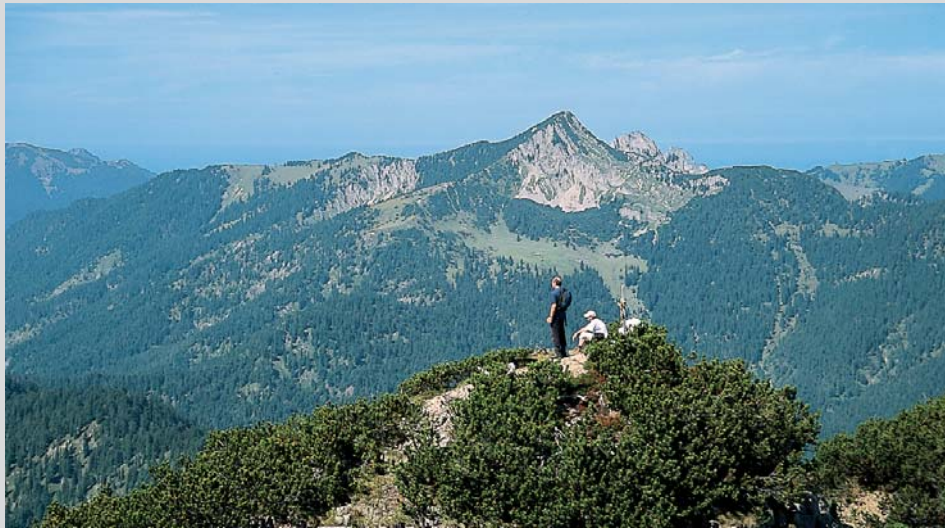
Am Gipfel des Bayerischen Schinder; im Hintergrund der Risserkogel.

gen diesem kurz nach rechts und verlassen ihn dann nach links auf einen ausgeschilderten Wanderweg. Gut 45 Minuten nach der Schlagalm wird der Weg steiler und der Wald geht in Latschen über. Bald lassen wir auch diese hinter uns und steigen nun recht mühsam durch das steile Schinderkar hinauf zum sogenannten Schindertor , ca. 1610 m, einem Felstor mit einer ungefähr drei Meter hohen, fast senkrechten Stufe. Diese überwinden wir mit Trittstiften und Seilen. Anschließend geht es durch eine felsige Rinne, dann entlang eines Seiles steil durch schroffes Gelände hinauf zu einer Gabelung in einem Sattel, ca. 1650 m.