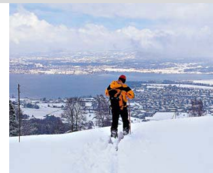
Wer so auf Lachen blickt, hat gut lachen.

Vom vorderen Gipfel, dem Vermessungspunkt, fährt man nordostwärts hinab gegen die Hütte am P. 1153, dann wenig rechts davon durch eine Schneise zu den Diebishütten (1085 m). Weiter zum Waldeggli , wo über den Gigerli-Hang auf die nächste Stufe abgefahren wird. Die nun bevorstehenden Hänge sind die schönsten, die Ecknamen dazu: Giger, Zug, Schweiogrüti (über 30° steil, lässt sich rechts über Landlüttenhof umfahren), P. 531, P. 441. Dort ist der Spaß zu Ende und der Bahnhof Lachen 15 Spazierminuten entfernt.