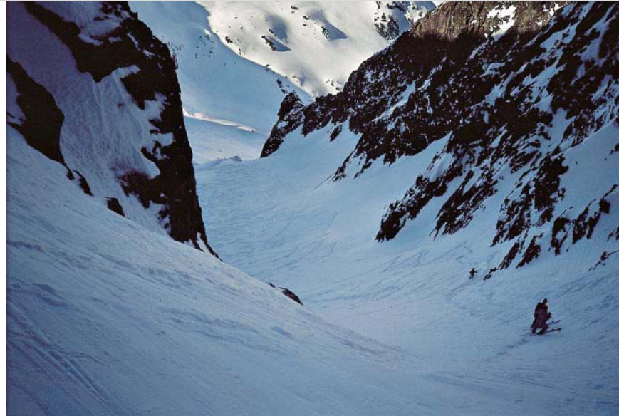
Die schönen Hänge ins Tal von Pierre à Bérard.

sollte keine nennenswerte Spaltengefahr bieten. Häufig begangene Tour.