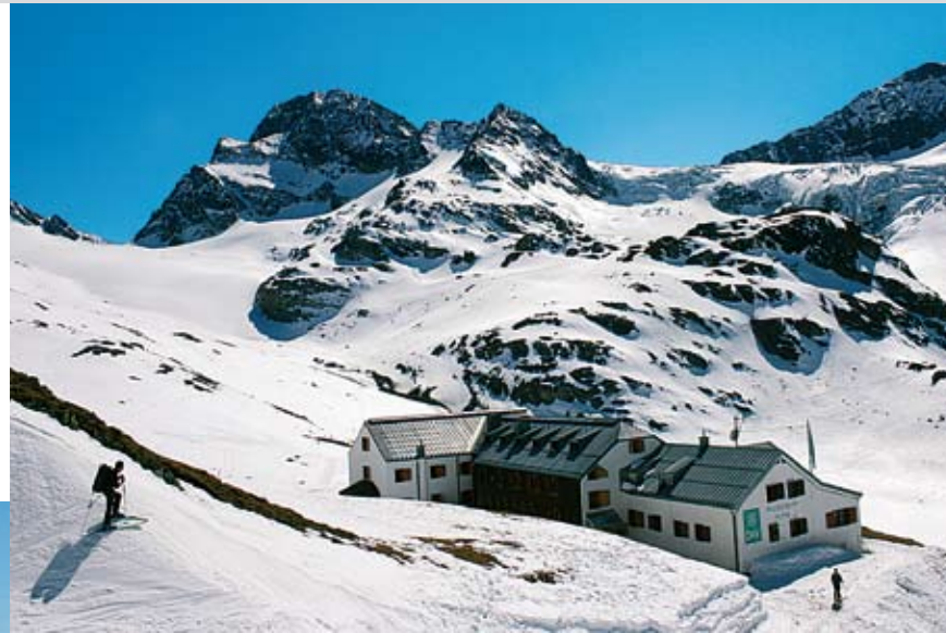
Die Wiesbadener Hütte mit Piz Buin und Ochsentaler Gletscher.

Talort: Partenen, 1051 m, im Talschluss des Montafon, am Beginn der im Winter gesperrten Silvrettastraße.