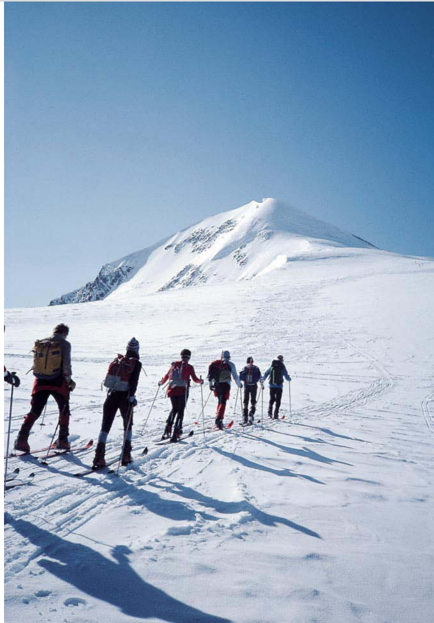
Gruppe beim Aufstieg zum Similaun, den Gipfel bereits im Blickfeld.

Die Abfahrt folgt dem Anstiegsweg. Es gibt aber anspruchsvollere Varianten. Etwas schwieriger ist die Abfahrt, wenn man sich rechts hält und über den östlichen Lappen des Niederjochfernens abfährt (Vorsicht, Spalten!). Eine sehr schwierige Abfahrt (Schwierigkeit »schwarz«) beginnt auf dem Gipfel, von dem man nach Osten über den Grafferner zum Similaunjoch abfährt. Die ersten 200 Hm sind ungewöhnlich steil! Vom Joch quert man über den flachen Gletscher ansteigend zur Mittleren Marzellspitze, 2532 m. Über den Nordostgrat (Firn, Blockwerk, Ski tragen) ins Marzelljoch, 3450 m, kurz hinunter und Richtung Nord zum üblichen Anstieg zur Hinteren Schwärze (meist viele Spuren) queren. Abfahrt über den Marzellferner (gefährliche Spalten!), dann unterhalb des Marzellkamms im Bogen zum Niederjochbach und zur Hütte.