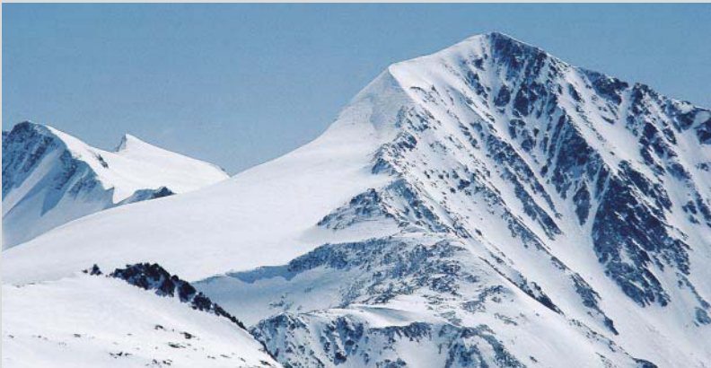
Die Route auf den Similaun führt über den Rücken, der sich zum Grat aufsteilt und verschmälert.

Von Vent auf dem Sommerweg durchs Niedertal zur Martin-Busch-Hütte . Der Hüttenanstieg quert die Ostflanke und kann bei Weichschnee lawinen- und bei Hartschnee absturzgefährdet sein. Von der Hütte in den Talboden und auf der im Anstiegssinn rechten Seite des Niederjochbachs anfangs mit geringem, dann mit gutem Höhengewinn talein. Über den nahezu spaltenlosen Niederjochferner erreicht man die Similaunhütte im Niederjoch, die von Südtirol aus bewirtschaftet wird. Von der Hütte steigt man rechts von einem Gletscherbruch auf und hält sich allmählich neuerlich rechts zum Ansatz des Gipfelgrats. Kurzzeitig wird es steil, dann errichtet man das Ski-depot am Beginn des Grats und erreicht über diesen unschwierig, aber ziemlich ausgesetzt, den Gipfel des Similauns .