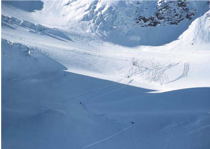
Abfahrts Spuren vom Eisseepass (Cevedale) und von der Suldenspitze zur Schaubachhütte.

Der Monte Cevedale gilt als leichter Dreitausender und höchster Skigipfel der Ostalpen. Da zudem eine Seilbahn den Anstieg ganz erheblich verkürzt, wird er überaus häufig bestiegen. Eine Nächtigung auf der Schaubachhütte ist für einigermaßen gut trainierte Skibergsteiger nicht nötig, hat aber ihre Vorteile. Sie ermöglicht einen frühzeitigen Aufbruch und damit die Chance, dem Kolonnenverkehr zum Gipfel zu entgehen.