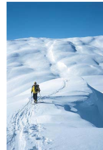
Die Osthänge der Hochrast.

ten. Genau gegenüber die Sextener Dolomiten – eine großartige Schau berühmter Klettergipfel! Deutlich zu erkennen sind z.B. die Rotwand, der Einserkofel, die mächtige Dreischusterspitze und der Birkenkofel. Die Abfahrt folgt dem Anstiegsweg. Aufforstungen beachten, auf der in der Regel deutlich erkennbaren Abfahrtsroute bleiben oder die Forststraße benützen!