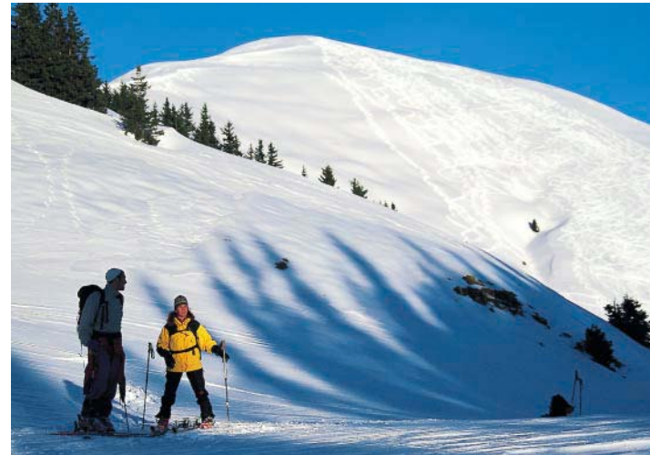
Bei Pulver und Firn fantastisch – der südwestseitige Gipfelhang am Schönalmjoch.

Zugegeben, zu den absoluten Parade-Skitouren im Karwendel zählt das Schönalmjoch nicht gerade. Doch wer an Juifen oder Schafreuter an einem schönen Wochenendtag schon das Schlangestehen übte, der wird sich gerne einmal in die stille Einsamkeit namenloser Nachbargipfel verziehen wollen. Dabei braucht das Schönalmjoch einen Vergleich mit den eingeführten Skibergeen gar nicht zu scheuen. Die Abfahrt über 1000 Höhenmeter entlang der Aufstiegsspur verläuft über den Gipfelkamm und die freie Schneise am Rücken Altkot. Danach benutzt man am besten die Forststraße. Und ganz oben wartet das Sahnehäubchen des Schönalmjochs. Hat man beim Anstieg noch den meist verblasenen Westkamm benützt, versprechen die wunderbar freien Südwesthänge unter dem Gipfel (siehe Bild)