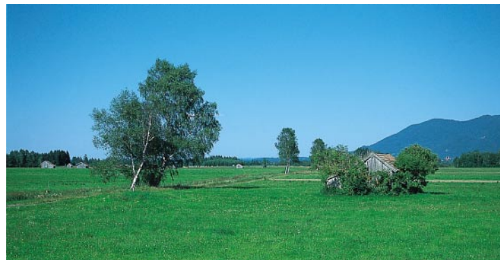
Landschaft in den Mondscheinfilzen

Wir fahren vom Parkplatz auf der Nebenstraße nach Sindelsdorf hinein, biegen dort an der Kirche nach rechts ab und rollen mit ersten Ausblicken auf die herrliche Landschaft vor uns aus dem kleinen Ort hinaus. Vor der Autobahnbrücke verlassen wir die Asphaltstraße nach links und fahren ein paar Kilometer auf einem geschotterten Wirtschaftssträßchen parallel zur Autobahn direkt an den abwechslungsreichen Feuchtgebieten vorbei, bis wir wieder auf die Teerstraße stoßen. Vor dem Ortsschild von Zell biegen wir links ab und rollen nun bequem direkt in die wunderschönen »Mondscheinfilze« hinein. Vor dem Triftkanal wenden wir uns rechts, überqueren bei der nächsten Gelegenheit das alte Kanalbett nach links und gelangen so schon bald zum idyllischen, schilfumsäumten Eichsee mit Liegewiese, der hier zum Bad einlädt. Vom Eichsee geht es wieder Richtung Süden und wir stoßen schon bald auf den Dammweg der Loisach, die in unserer Richtung dem Kochelsee zustrebt. An der Staatsstraße von Schlehdorf nach Kochel wenden wir uns links und radeln zügig auf einem schönen straßenbegleitenden Radweg von der Südostspitze unserer Filzumrundung zu der Südwestspitze, wo wir nun den Ausfluß der Loisach aus dem Kochelsee überqueren.