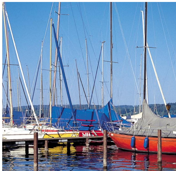
Radlers Traumziel: Starnberger See.

Rad: Vom Bahnhof in Bernried fahren wir bergab in Richtung Kirche und biegen nach zwei Straßenkehrungen rechts ab. Am Westrand des Bernrieder Parks radeln wir südwärts zum Schloß bei Seeseiten und weiter am Starnberger See entlang nach Seeshaupt . An der Kirche rechts abzweigend