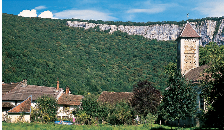
Les Planches-près-Arbois au pied du »fer à cheval«.

petit crochet à droite par le Belvédère de l'Ermitage qui vous offre une vue magnifique sur Arbois.