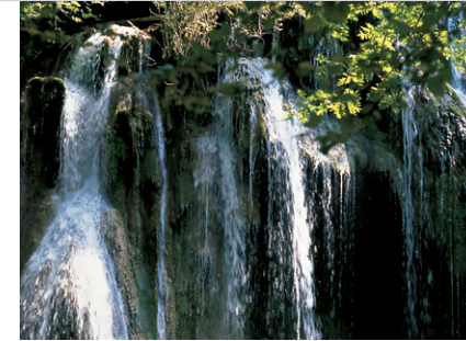
De la mousse épaisse recouvre les rochers sous l'eau de la Cascade des Tufs.

Dans la Rue de la Cascade, vous passez après le bourg devant un parking et le restaurant Le Moulin. Le GR goudronné au départ puis herbeux se redresse en offrant de belles vues sur le cirque dont les parois se dressent de-