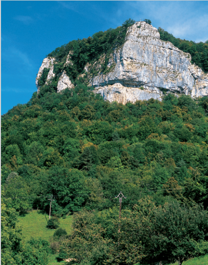
Le Cirque du Fer à Cheval avec ses rochers calcaires à la verticale.

vant vous à la verticale. À la première bifurcation, nous vous conseillons de faire à droite un crochet intéressant par la Cascade des Tufts où l'eau dévale en formant comme un voile sur des versants moussus. De retour sur l'itinéraire principal, suivez les repères blancs-rouges à droite vers le cirque avec la Petite Source de la Cuisance (pancarte) jusqu'à ce que les parois rocheuses vous empêchent de continuer au Cul des Forges .