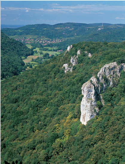
Vue magnifique sur le cirque jusqu'à Arbois depuis le Belvédère du Fer à Cheval.

Le Cirque du Fer à Cheval avec ses falaises calcaires montant à la verticale est l'un des points d'orgue du Jura. Cette randonnée offre aussi un maximum de distractions : une forêt ombragée, une charmante vallée, deux sources, une grotte, des cascades moussues et une vue magnifique sur Arbois depuis la Chapelle de l'Ermitage et le Belvédère du Fer à Cheval.