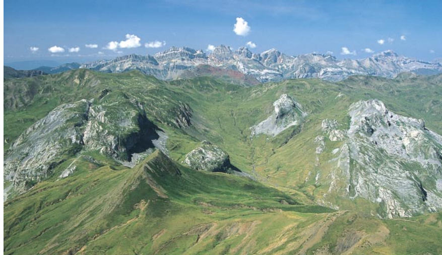
Le Pic Peyreget : vue du sommet sur la chaîne montagneuse espagnole de Candanchú.

chemin plus étroit qui se fauille à travers les versants sud du Pic de Peyreget. L'agréable chemin panoramique conduit sans dénivelée importante jusqu'au Col de l'Iou, 2194 m. A partir d'ici, il descend rapidement jusqu'au Lac de Peyreget où il se divise. Vous montez à droite à travers les versants herbeux puis vous arrivez, après une mare, à un effondrement de rochers. Suivez les cairns voire le balisage jaune à travers les dépôts d'érosion puis montez par un terrain très pentu sur le versant herbeux de la croupe jusqu'au Col de Peyreget, 2310 m. Une fois au col, prenez à droite un sentier balisé qui se dirige vers le versant nord aux roches brisées du Pic Peyreget. Plat au début, il se redresse ensuite et vous arrivez au sommet rocheux du Pic Peyreget , 2487 m. De retour au col, vous descendez maintenant par un chemin sinueux caillouteux et passez devant deux petits lacs. Après la traversée ensuite des versants herbeux, vous passez devant le Lac de Pombie et vous arrivez au magnifique Refuge de Pombie , 2031 m. A partir du refuge, orientez-vous sur le chemin tourné vers le sud qui monte tranquillement jusqu'au Col de Soum de Pombie à proximité puis reprenez par le chemin déjà connu au parking d'Anéou .