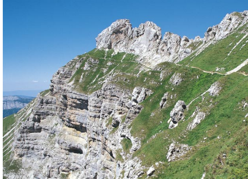
Le chemin d'altitude juste avant le sommet de la Tournette.

Depuis l'église de Montmin , une route goudronnée monte et débouche après 10 mn environ sur un chemin caillouteux. Juste après le chalet «Les Lieusaz», bifurquez à droite. Le chemin traverse une forêt pendant trois quarts d'heure puis le soleil tape jusqu'au sommet. 2 1/2 h après le départ, la