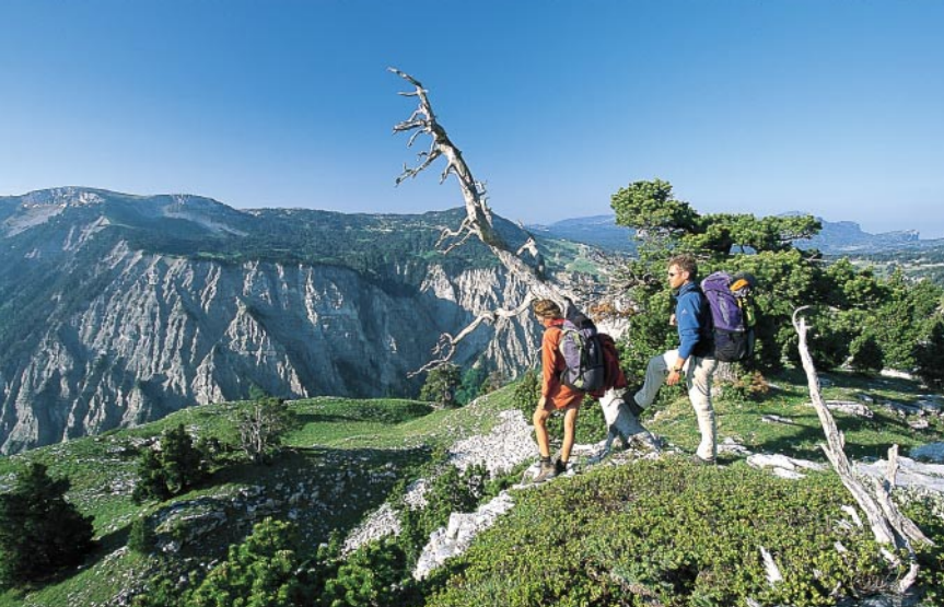
Les Hauts Plateaux du Vercors : la nature telle quelle.

Depuis le parking Les Fourchaux , 1024 m, prenez à droite le large chemin couvert d'éboulis qui monte en pente raide direction sud-ouest jusqu'au Pas de l'Aiguille . A mi-chemin, la forêt s'éclaircit et offre de superbes vues sur le Mont Aiguille. Juste après le passage rocheux du Pas de l'Aiguille, 1622 m, vous passez devant un monument rappelant la guerre et vous pénétrez dans une combe herbeuse avec la bergerie et, sur une colline un peu plus haut, le Refuge de Chaumailoux , 1669 m. Laissez le refuge sur la gauche et montez vers l'ouest par une petite selle. Une fois là, suivez les traces de sentier qui se détachent du sentier principal sur la droite. De temps à autre, vous êtes dérouteré par d'autres traces mais il est important de continuer dans la direction principale vers le nord/nord-est, toujours plus ou