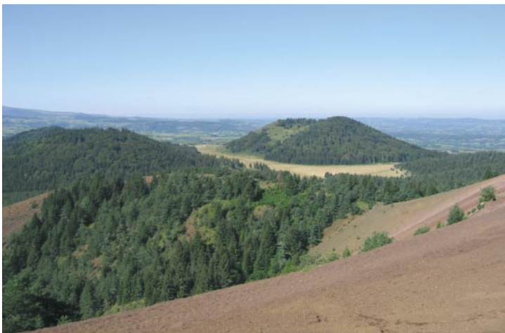
Derrière les sommets volcaniques reboisés s'étend le plateau de la Vallée de l'Allier.

sommet est une mer d'éboulis volcaniques rouges qui rappelle une immense dune. Le panorama à 360° sur la Chaîne-des-Puys, le Puy de Dôme et le Massif du Sancy à l'horizon ainsi que sur les chaînes montagneuses au loin des Monts du Forez est tout simplement impressionnant.