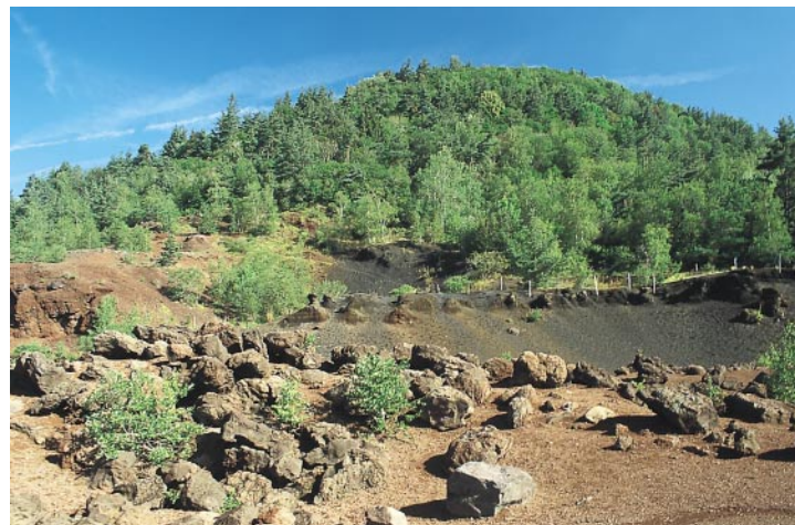
Les bombes de lave au pied du Puy de la Vache sont disséminées un peu partout.

des-Puys. La descente des »300 marches« commence sur le côté opposé à la montée et vous conduit vers une autre surprise. Les marches finissent en effet dans un monde irréel ressemblant à un paysage lunaire : des éboulis noirs et rouges avec, de-ci de-là, de gros blocs et des bombes de lave sur un terrain dégagé.