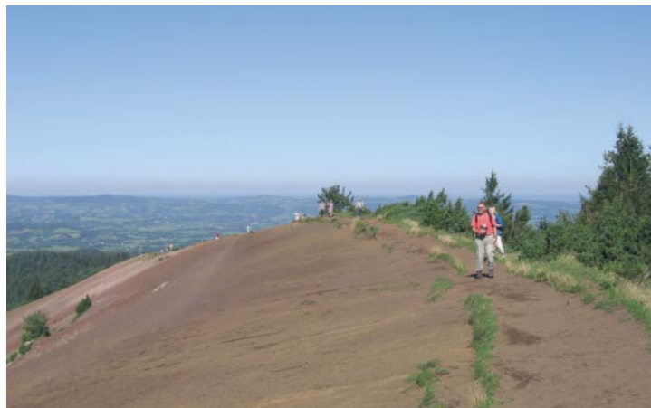
Sur le Puy de Lassolas, on marche comme sur du sable.

Cette randonnée vous amène dans le monde magnifique et bizarre de la Chaîne-des-Puys. Des sommets du Puy de Lassolas et du Puy de la Vache, vous apercevez le Puy de Dôme sous son meilleur jour ainsi que les sommets volcaniques alignés les uns à côté des autres sur un espace restreint avec des formes de cratère, des couleurs et une végétation des plus diverses.