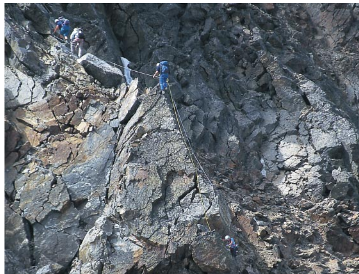
Grimpette difficile avec vue, c'est ce qui vous attend à la ferrata du Jegihorn.

Montée : depuis la station intermédiaire de Kreuzboden (2397 m), suivez le sentier balisé jusqu'aux Weissmieshütten (2726 m). Derrière les chalets rustiques, suivez la voie normale du Jegihorn à gauche, traversez le Trift-