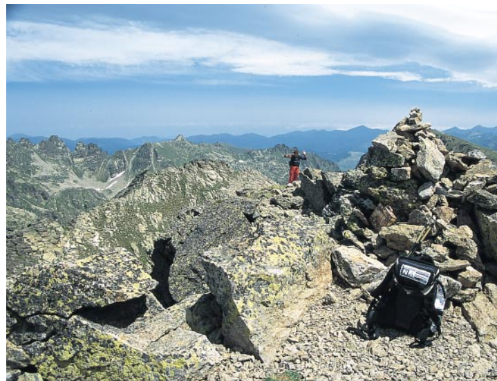
Le Pic d'Escobes, but de la variante.

ruisselets avec quelques collines rocheuses isolées. Le chemin oblique ici à gauche et traverse la Pleta tandis qu'une passerelle en béton vous ramène de l'autre côté du ruisseau. A proximité d'un tunnel rocheux servant à réguler l'écoulement du lac, traversez une dernière fois le lit, presque toujours asséché, du ruisseau. Juste avant le premier lac, le chemin se divise en deux ramifications qui montent tranquillement à gauche pour l'une et plus fortement à droite pour l'autre. Les deux sentiers conduisent au petit barrage de l'Estany Primer de Juclar. Juste derrière, tournez à droite comme l'indique le panneau et remontez le versant herbeux vers le Refugi de Juclar , 2320 m. De là le chemin longe la berge en pente, continue au-dessus du lac jusqu'à son extrémité est puis redescend – par endroits sur une pente couverte de blocs – jusqu'à la langue de terre entre les deux lacs. Une fois arrivé sur le côté ouest de l'Estany Segon de Juclar où vous traversez le ruisseau d'écoulement par une passerelle métallique, le chemin se redresse bien sur la berge en pente, s'éloigne du lac et s'étire direction nord vers la Collada de Juclar , 2442 m. La croupe offre une belle vue sur les lacs lorsque vous vous retournez. Après un tournant serré à droite, remontez par un terrain pierreux, raide au départ puis plus plat, vers le Coll de l'Alba , 2546 m, situé à proximité.