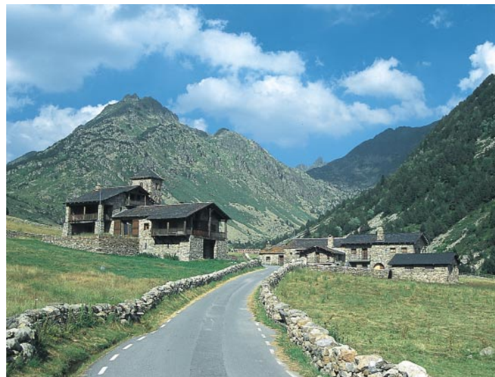
Vall de Juclar.

L'ascension bien balisée par des cairns comprend des passages très escarpés jusqu'au Coll de Noé ainsi que de l'escalade (II) jusqu'au sommet. Du Coll de l'Alba, suivez les marquages sur les rochers et les traces de sentier au début en direction sud vers l'arête de la croupe, puis tournez à mi-droite et remontez le flanc nord-nord-ouest pour arriver à un long couloir »herbeux« qui descend du Coll de Noé. La petite »croupe« sur l'arête couverte de blocs de roches est reconnaissable à une plaque de rocher en porte-à-faux qui ressemble d'en bas à une cheminée penchée. Ascension très raide dans ce couloir qui devient rocheux vers le Coll. De là, un sentier traverse le versant vers une étroite croupe au pied du Pic d'Escobes. Ici escalade de l'arête vers le sommet exposé. Durée totale Coll de l'Alba aller-retour 2 ½ h.