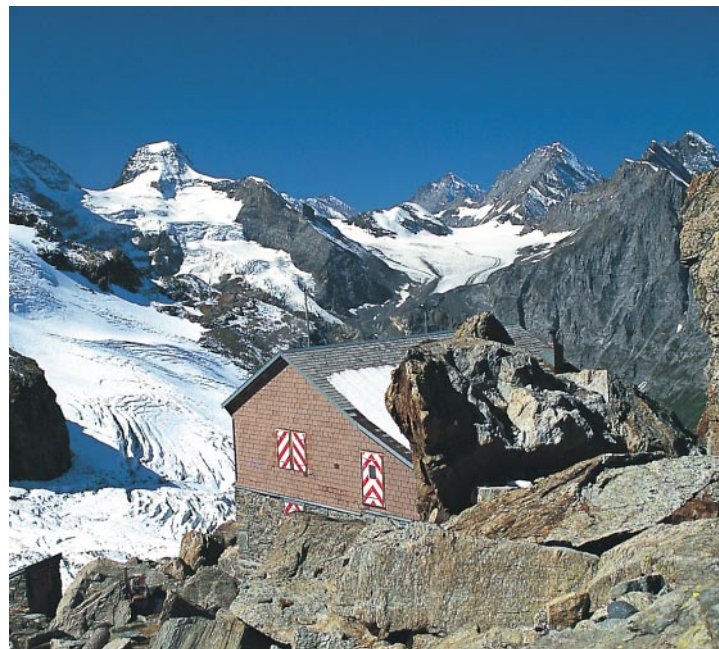
Quel bel endroit : vue sur le Tschingelhorn, le Doldenhorn et la Blüemlisalp (de g. à d.)

De Stechelberg , suivez le sentier muletier à l'est de la Lütschine sur 400 m jusqu'à une bifurcation à gauche du sentier balisé qui mène à la cabane. Il conduit en pente raide jusqu'aux parois de la Staldenflue, les longe sur une vire partiellement exposée jusqu'à l' alpage d'Altläger (1580 m) ; ce sentier est appelé »Zügelweg«, car il servait lorsque les habitants s'installaient sur l'alpage en été (zügeln = déménager en suisse allemand). Le sentier monte en zigzaguant jusqu'au Schafbach, le traverse et suit une moraine par P. 1937,