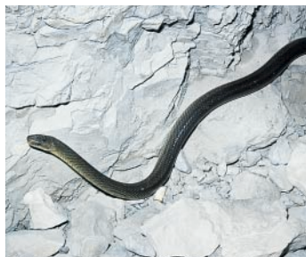
L'inoffensive couleuvre d'Esculape – ici dans le premier tunnel – peut atteindre deux mètres.

Point le plus bas : 558 m dans les gorges.