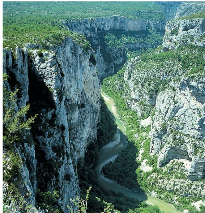
Vue plongeante vertigineuse dans les Gorges du Verdon.

700 m de long qui rend indispensable une lampe de poche et qui est très glissant en raison de l'eau qui dégouline. La descente d'une ouverture dans le tunnel par une échelle en fer vers la Baume aux Pigeons était barrée. Au bout du tunnel, nous descendons par quelques escaliers vers le fleuve (610 m, 2 h tout juste) et jetons un coup d'œil sur le couloir sauvage. Nous traversons ensuite un affluent et remontons vers un parking par un escalier raide (taxi temporairement). À l'extrémité gauche, nous prenons le sentier balisé en blanc et rouge (GR 4) qui monte en pente raide vers la D 952 que nous suivons à gauche sur environ 150 m vers l' Auberge du Point Sublime (783 m, 50 mn). De là, retour en taxi au point de départ la Maline.