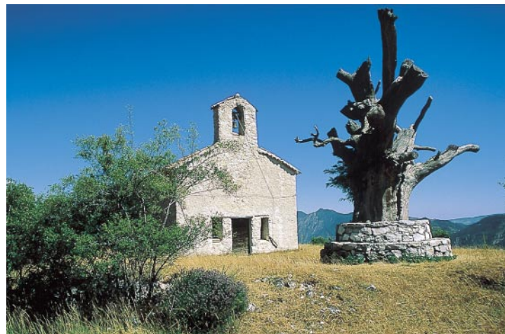
La chapelle St-Julien.

On revient sur le col de la Barbenière et on prend le chemin qui descend exactement en angle droit à gauche (pas le chemin forestier) en direction de la chapelle St-Julien (balisé en jaune après 80 m). Le sentier traverse la forêt à essences mixtes et rejoint après \frac{1}{4} h le chemin forestier. En face à 500 m environ à vol d'oiseau, on peut voir la chapelle St-Julien. Le sentier balisé en jaune suit un tracé sinueux : à droite sur le sentier forestier et, après 25 m à gauche. Après quelques 60 m supplémentaires (un marquage jaune en forme de crochet sur la droite ; sur la gauche une ferme), on tourne dans un virage prononcé à droite. On passe devant deux fermes abandonnées. A peine 100 m après la dernière, le sentier bifurque à gauche. A partir de là, il est facile de s'orienter du plateau de Dina à la cha-