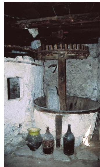
Le vieux moulin à huile de Rigaud.

Dans le cas où on a garé son véhicule sur le parking du village à Rigaud , au bout duquel (#202, croix en fer) on prend le chemin qui descend à gauche, on aboutit après 5 minutes sur une petite route (#204). Par contre, si le véhicule est garé près du cimetière, on prendra simplement la petite route jusqu'au #204. A celui-ci, on prend le chemin qui bifurque et qui monte. Après ¼ h de marche, on arrive à une bifurcation : on prend le sentier qui descend légèrement et on arrive après quelques pas directement au lit du fleuve dans lequel s'écoule un petit ruisseau. Environ 100 m en amont, sur l'autre rive, on peut repérer une balise (#205) près d'un gros rocher lisse de 2 m sur 3 m. De là, encore 20 m en amont, le sentier sinueux continue à grimper à droite. Après quelques minutes, le sentier bifurque ; ici on prend à gauche (balisage rouge-blanc du GR). A partir de là, on ne peut plus se tromper. Le