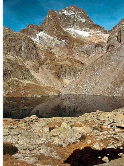
Ibón de Arriel Alto et Pico Palas.

dans une magnifique série de cascades à la sortie des gorges étroites («Paso del Onso»).