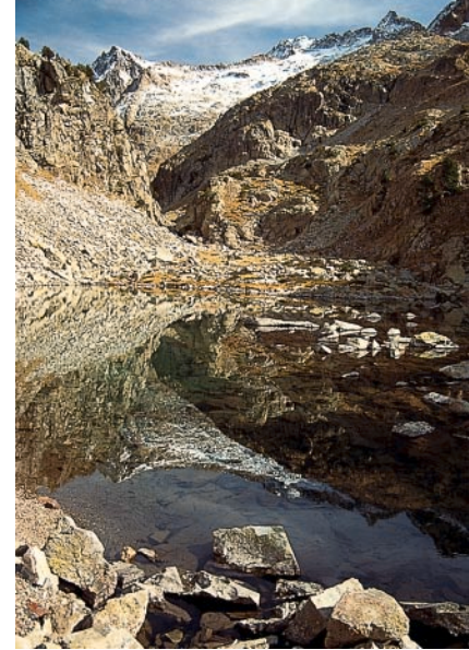
Ibón de Arriel Bajo.

Juste avant, un sentier enherbé difficilement visible bifurque vers la droite (ne manquez pas les pierres de balisage), et grimpe sur la bosse granitique. En haut, vous vous trouverez à quelques mètres au-dessus du très bel Ibón de Arriel Alto , 2230 m, et vous aurez finalement tout le loisir de choisir le plus beau point de vue dans ce paysage légèrement vallonné.