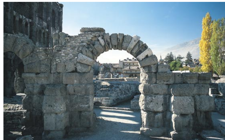
Les ruines du Teatro Romano ; à gauche une partie de la façade ouest du théâtre.

Se diriger de la Viale F. Chabod / angle Strada della Consolata (près de la route nord qui monte vers le Gd. St-Bernard) sur la route indiquée ci-dessus vers le sud, en passant devant la partie nord-est du mur d'enceinte romain (marquée par le Torro dei Balivi datant du 13ème-15ème siècle) pour bifurquer ensuite à gauche. Quelques minutes plus tard, on atteint la grande église romane Sant'Orso . Il s'agit d'une construction de l'époque carolingienne qui fut transformée à la fin du 15ème siècle par George de Challant (prieur de Sant'Orso) en une basilique gothique. Les stalles et les fresques