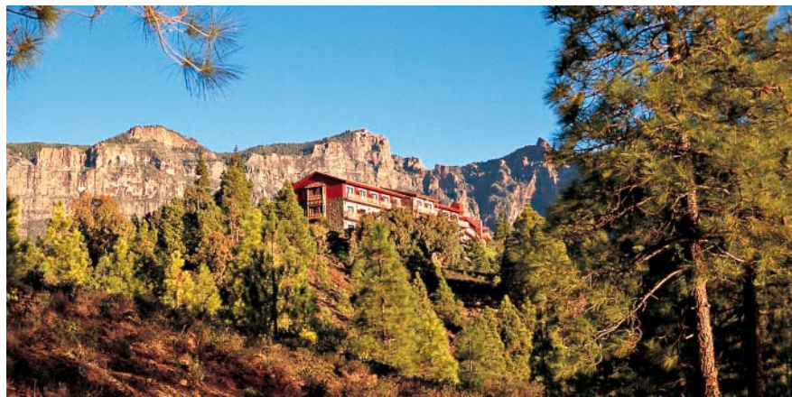
Hotel Las Tirajanas.

A 200 m torcemos a la derecha hacia el «Camino del Pinar» (señalizado), en el cruce en forma de T a 100 m nos mantenemos a la izquierda y en la siguiente bifurcación, a 500 m, a la derecha. La pista sube hasta la «Granja», un gran cebadero de cerdos con el mal olor correspondiente. Allí la pista se