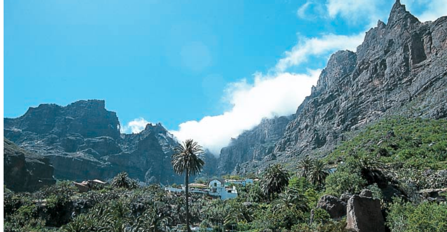
Pared rocosa al noreste de San Bartolomé.

Este callejón se dobla hacia la derecha (cartel «Camino Manzanilla el Pinar») y asciende empinado a una carretera por la que nos mantenemos a la izquierda. A 100 m ignoramos el desvío a la derecha, otros 100 m después pasamos el acceso al hotel de cuatro estrellas Las Tirajanas .