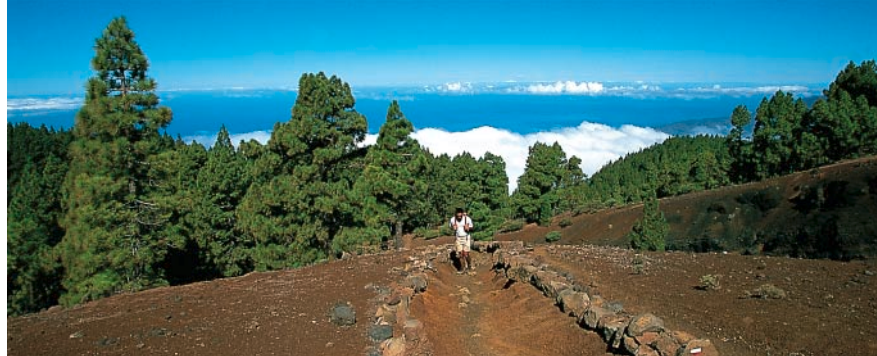
Ascensión a la cresta de la Cumbre Vieja.

Desde la carretera cruzamos la zona recreativa hasta el Refugio del Pilar , en la bifurcación 50 m después del Centro de Visitantes (exposición interesante sobre la Cumbre Vieja), seguimos en dirección a «Los Canarios» (GR 131, blanco-rojo). A los 10 minutos, en la bifurcación, nos desviamos otra vez a la derecha. Al principio el sendero discurre por un pinar maravilloso, más tarde se abren a la vista del marco de montañas de la Caldera de Taburiente y del Valle de Aridane. Cruzamos la ladera de grava lávica del Pico Birigoyo – sólo los helechos, la retama y los pinos ofrecen un contraste al paisaje marcado por la arena negra. Al cabo de un total de 40 minutos, el sendero se incorpora a una pista forestal por la que continuamos subiendo a mano izquierda. 15 minutos más tarde – nos encontramos otra vez en un pinar poco espeso – el GR 131 se desvía a la derecha, para continuar por un camino que discurre por un paraje, que la naturaleza parece haber conformado como un parque: la retama se refugia en las rocas de lava color