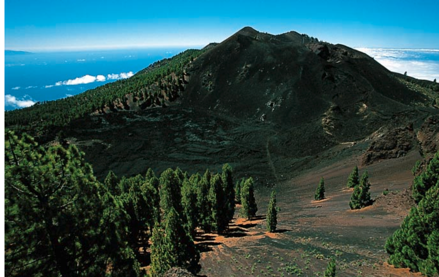
La colada lávica de La Malforada con la Montaña del Fraile.

Siguiendo por la Ruta de los Volcanes, enseguida aparece el próximo cráter con la colada, negra como el carbón, de La Malforada. El camino discurre bordeando el cráter por la derecha y se bifurca en el punto más bajo del borde del cráter al pie de la Montaña del Fraile (¼ h.). De frente se desvía un sendero hacia la cumbre principal de la Deseada, 1.945 m (el sendero se acerca al Cráter del Duraznero, al final continuamos a la izquierda); pero seguimos a mano derecha por el camino señalado. Primero desciende levemente y rodea el Duraznero ampliamente, discurrendo por un valle, que va empinándose, hasta llegar a la cumbre de la Deseada II , 1.932 m (½ h.). Nuestros esfuerzos se ven recompensados con