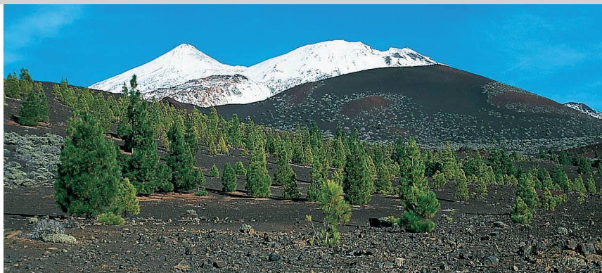
En el inicio de la ruta: la Montaña de la Botija, detrás el Pico Viejo y el Pico del Teide.

cha, con su doble elevación, La Palma. 15 min después de la última bifurcación el camino se allana. Ante nosotros se alza ahora el enorme Pico Viejo, por detrás sobresale el pan de azúcar del Teide. El sendero se dirige directamente a estas cimas y sigue, a continuación, por el borde izquierdo de un campo de lava, situado en un valle llano. Poco a poco, al cabo de \frac{3}{4} h en total, llegamos a la altura de una loma de arena de lava. A la izquierda, un poco más abajo, vemos un pino joven solitario. Aquí nuestro sendero hace un giro brusco a la izquierda, en dirección a la Montaña de la Botija (el camino de frente hacia la cercana Montaña Reventada ha sido cerrado por cuestiones medioambientales).