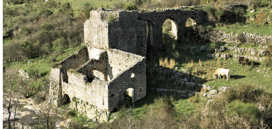
Mühlenuine bei Trentinara.