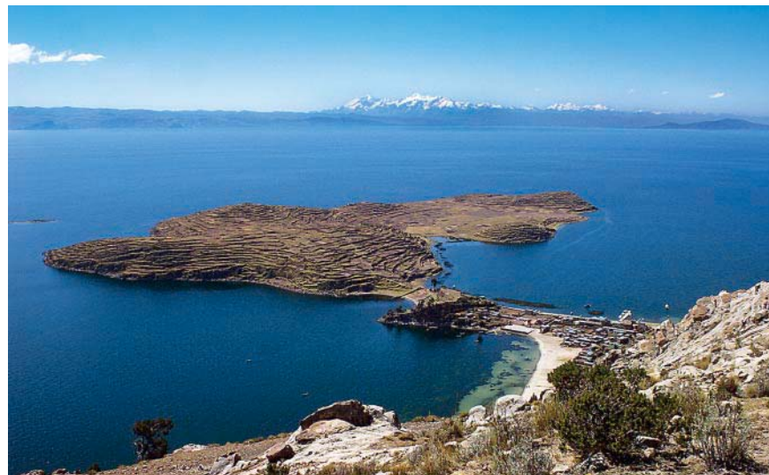
Der Hafen von Challapampa.

Ansonsten führt der Weg durch vielseitige Strauch- und wiederum Eukalyptusflächen zuerst am Strand entlang und dann mit erneut einigem Auf und Ab zurück zur Puerta del Inca . Dabei durchwandern wir die beiden noch völlig ursprünglichen Andendörferchen Pukara und Yumani mit ihren prächtigen Steinhäusern und einigen preiswerten Einkehrmöglichkeiten.