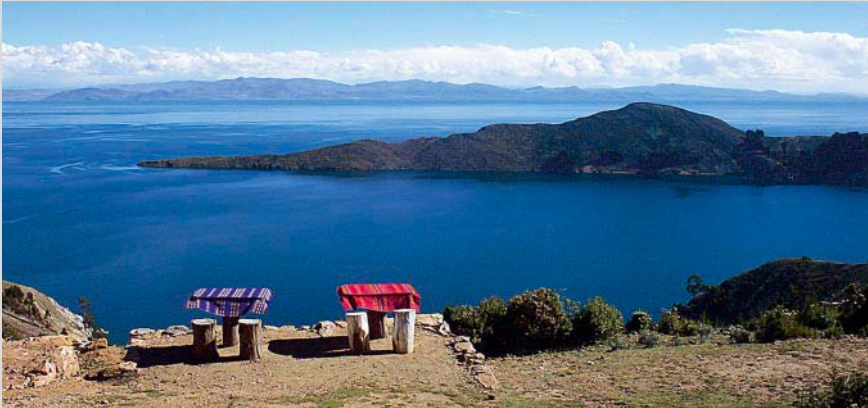
Blick über den tiefblauen Titicacasee.

der Weg durch eine urige kleine Wohnsiedlung mit Restaurants und Hotels. Mit etwas Glück begegnen wir hier oben Lamas und Eseln, die vielleicht wir die prächtigen Tiefblicke auf den blau glänzenden See genießen. Weiter oben beherrschen die weit über 6000 m hohen Andenriesen Illampu und Ancochuma mit ihren strahlend weißen Eisflanken das Bild. Wenig später sind wir auch schon auf der Anhöhe angekommen und links am Weg steht dann gut sichtbar das Hotel Puerta de Sol , nebst weiteren Hotels und Restaurants direkt auf dem Hochrücken.