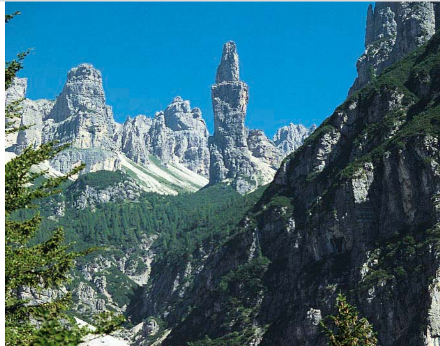
Ohne große Mühen möglich: Blick zum »unlogischsten Berg der Welt«.

ersten Belvedere del Campanile di Val Montanaia , 1405 m, mit kleiner Aussichtsplattform, und weiter in wenigen Minuten zum etwas höher gelegenen zweiten Belvedere del Campanile di Val Montanaia , 1435 m, mit hölzerner Plattform und Panoramatafel. Trotz der großen Entfernung haben wir bereits von hier aus einen sehr schönen Blick auf den Campanile di Val Montanaia. Für den Rückweg steigen wir bis zur erwähnten Abzweigung ab, dann gemäß den WW Val Montanaia, Bivacco Perugini und Campanile di Val Montanaia kurz in das Val Montanaia bergauf; wir queren das grobschottrige Bachbett auf einem gut sichtbaren Steig, der durch Steinmännchen bezeichnet ist. Bald treffen wir auf den Weg, der vom Rifugio Pordenone heraufkommt. Diesem Weg folgen wir durch Wald abwärts zum Rifugio Pordenone und zurück zu unserem Ausgangspunkt.