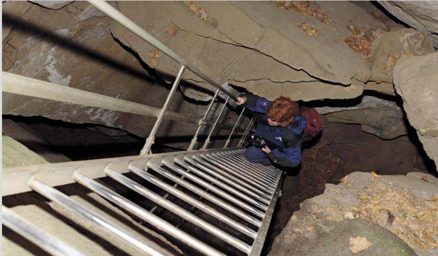
Leiteraufstieg zur Räuberhöhle im Felsenlabyrinth.