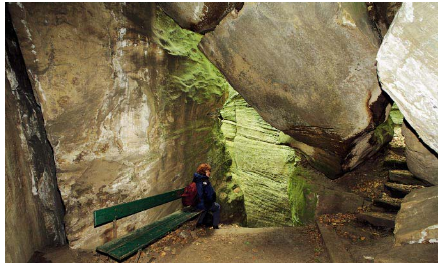
Totenkammer im Felsenlabyrinth.

auf in den Wald. Wir wandern jetzt auf der Promenade BV und auf dem grünen Dreieck weiter. Bei den Felsen verlassen wir das grüne Dreieck und wandern auf der Markierung blaues Fähnchen daran entlang. In der Wegkurve sehen wir hinab ins Sauerland und auf den Campingplatz. Kurz darauf biegen wir an der nächsten Weggabelung links ab in Richtung Beaufort (Schild). Wir treffen auf einen breiteren Weg, dem wir nach links am Waldrand entlang folgen. Die nächsten 2 km wandern wir ohne Markierung geradeaus über die Felder nach Beaufort. Nach der Ferme Weber (Bauernhof) erreichen wir Beaufort. Hier geht es auf der Straße C.R. 364 schwach links und auf der Route de Grondhaff am Kreisel geradeaus zur Kirche St. Michel. Am nächsten Kreisel gibt es einen Skulpturengarten. Auf der Rue de l'Église kommen wir am Rathaus (Mairie) vorbei, bevor uns nach 100 m an der Grand-Rue , der Hauptstraße, rechts ein Fußweg zurück zum Schloss Beaufort bringt.