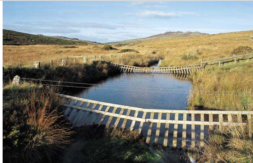
Holzkonstruktionen überspannen den De Lank River.

und finden weiter oben einen stile . Dahinter gehen wir leicht rechts zur Zufahrt der Brown Willy Farm hinauf und entlang der Mauer weiter, bis sie nach rechts abknickt. Wir behalten unsere Richtung bei und laufen auf undeutlicher Spur ins Moorland hinaus. Nach einer Zeit des sanften Anstiegs taucht ein einzelner aufrechter Stein auf, dann das eingezäunte Areal der King Arthur's Hall . Wir passieren diese in gerader Linie, treffen auf ein Mauereck und halten uns rechts der Feldmauer, bis wir, nach einem knappen Kilometer, die Häuser Casehill und Candra erreichen. Eine Teerstraße bringt uns über den Hügel zu einer Querstraße, wo wir links abbiegen. Nach einem Viehrost kommt ein kleiner Anstieg, und die Kirche von Churchtown rückt ins Blickfeld. Auf Höhe der Zufahrt zum Anwesen Palmers biegen wir rechts in den public footpath durch das Ginstergrasland. Bald gehen wir an einer Mauer entlang, über einen steinernen stile und am rechten Feldrand weiter. Nach einem Strommast betreten wir per Durchlass das nächste Feld und durchlaufen es nahe dem linken Rand auf sumpfiger Spur zum stile . Dahinter gehen wir 50 Meter geradeaus zur Feldbegrenzung, benutzen links den Steinstile und kommen durch ein Gärtchen. Eine Pferdekoppel queren wir der Länge nach durch das enge kissing gate in der Mitte und das Holzgatter in der hinteren rechten Ecke zum Fahrweg. Rechts eines Hauses durch ein weiteres Gatter. Bei Friedhof und Kirche gelangen wir zur Hauptstraße in Churchtown zurück.