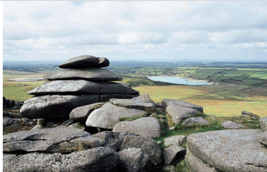
Auf dem Rough Tor.