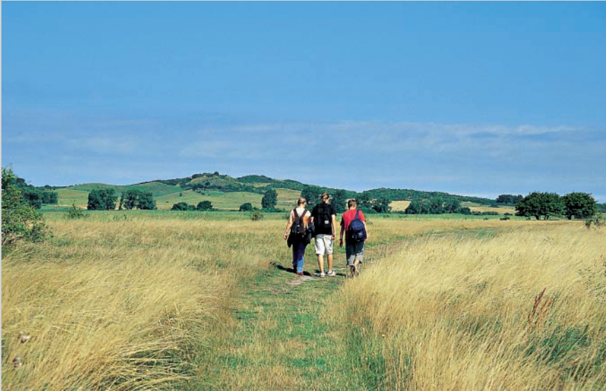
Auf dem Alten Bessin, im Hintergrund der Swantiberg auf dem Dornbusch.

über die beiden von Anlandungsprozessen gebildeten Sandhaken. Während der Neubessin als Kernzone im Nationalpark Vorpommersche Boddenlandschaft ausgewiesen und für Besucher gesperrt ist, steht der Alt-bessin Wanderern offen. Nach einem zweiten Gatter wandern wir nun über Land, das es vor 400 Jahren noch gar nicht gab. Pittoresker Blickfang sind vorgelagerte Schilfinselfen, über den Vitter Bodden genießen wir weiterhin den Ausblick auf den Dornbusch.