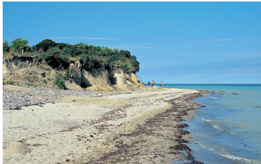
Am Enddorn auf Hiddensee.

Wieder zurück am Trafohäuschen gehen wir nun rechts über eine Anhöhe hinweg. Der Weg mündet an einem Fahrradparkplatz auf einen Betonplattenweg, dem wir geradeaus auf aussichtsreichem Abstieg hinab nach Kloster folgen.