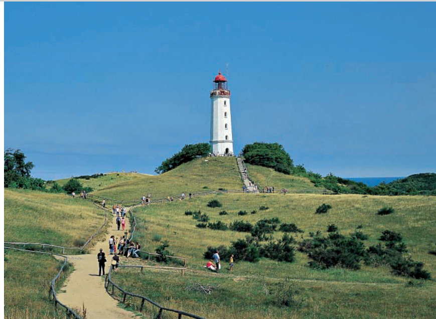
Der Leuchtturm auf dem Dornbusch.

Hinweis: Der Leuchtturm auf dem Dornbusch kann von Mai bis Okt. täglich von 10.30–16 Uhr bestiegen werden.