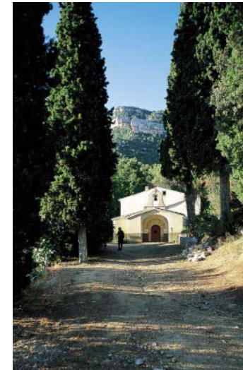
Ermita de Sant Antoni.

Der Montsant bildet auf seiner Nordseite ein gewaltiges Schluch- tensystem von beeindruckender Schönheit. Der Hauptfluss Riu de Montsant sammelt die vielen Bar- rancs zwischen der Serra Major des Montsant und der Serra de la Llena im Norden. Er hat sich tief in die ver- schiedenfärbigen Gesteinsschich- ten eingefressen, diese damit frei- gelegt und bis zu 500 m hohe ter- rassierte Schluchtwände entstehen lassen. Unsere Wanderung führt in den obersten Teil dieser Schlucht, hinunter zwischen die Wände, wo der Fluss (auch im Sommer) über fein geschliffene Felsplatten läuft. Wir überqueren ihn auf schwanken- der Hängebrücke und steigen in ein Seitental auf zur ältesten Einsiede- lei am Montsant, der Ermita de Sant Bartomeu , einem Ort von beeindru- ckender Stille und Abgeschieden- heit.