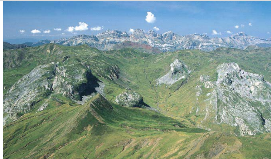
Pic Peyreget: Gipfelblick auf die spanische Bergkette von Candanchú.

Einkehr: Refuge de Pombie (☎ 0559/053178); Col du Pourtalet, Gabas.