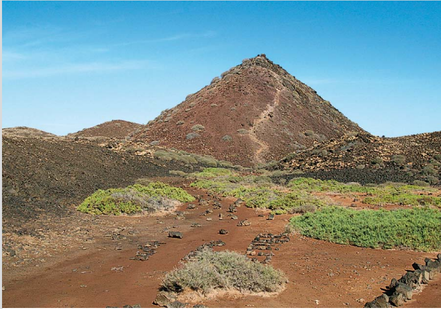
Markenzeichen von Lobos sind die durch vulkanische Aktivität aufgehäuften »hornitos«.

dem salzigen Lebensraum zurecht. Helle Sandstreifen kontrastieren mit schwarzer Lava und dem Grün der Vegetation. Die seichten Lagunen sind auch ein gefundenes Fressen für etliche Vogelarten.