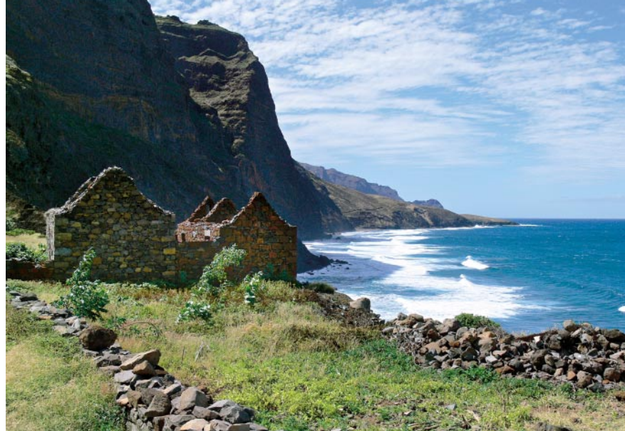
Häuserruinen bei Aranhas.

ansonsten einfach. 5 Min. später kommt man durch das nächste Flusstal über einen Trampelpfad noch einfacher an den Strand. Wer den ersten Zugang benutzt hat, kann bei niedrigem Wasserstand am Strand entlang wandern und im zweiten Flusstal wieder zum Wanderweg hinaufsteigen.