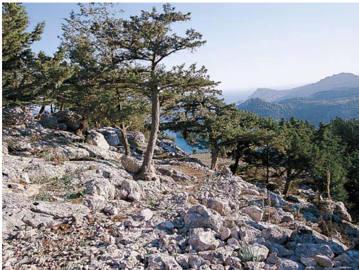
Der Abstieg vom Tsambika-Berg erfolgt auf einem wunderbaren Panoramapfad.

führt, zunächst gemächlich und dann steiler hinab. Er ist mit roten Punkten und Steinmännern markiert. Nach etwa 15 Minuten stößt der Pfad auf ein relativ ebenes Felsband und verzweigt sich. Wir gehen nach links, bis nach nur kurzer Zeit zwei rote Pfeile nach rechts unten weisen. Das ist die einzige Abstiegsmöglichkeit zum Tsambika-Strand , den wir in zehn Minuten an seinem nördlichen Ende erreichen. Er gilt als schönster Strand von Rhodos, unverbaut, ohne Hotels und feinsandig. Mehrere eher provisorische Strandtavernen und ein breiter Sandstrand mit Schirmen und Liegen laden zu einer längeren Pause ein. Wir wandern den etwa einen Kilometer langen Strand bis zum südlichen Ende entlang, wo vor uns ein steiler, sandiger Hang aufsteigt, der wie eine riesige Düne wirkt. Weiter oben verläuft ein Pfad, den wir am leichtesten folgendermaßen erreichen: Am rechten Ende des Hangs verläuft ein Tal und links davon im Hang eine schwach ausgebildete Mulde. In dieser Mulde steigen wir nach oben, bald geht es aber ohne richtige Orientierungsmerkmale weiter. Man suche sich einfach den angenehmsten Weg, gelegentlich findet man vielleicht auch Markierungen. Nach 10-15 Minuten trifft man auf den Pfad, dem man nach rechts folgt (nach links führt er bald zum östlichen oberen Ende des Hangs). Dieser