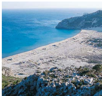
Tsambika-Strand vom Tsambika-Berg.

Endpunkt: Archangelos, 165 m, siehe Tour 7. Rückkehr nach Kolymbia mit dem Bus (Linie Lindos–Rhodos bis zur Abzweigung nach Kolymbia, Rome Street. Auf dieser knapp 1 km zum Ausgangsort).