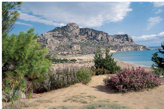
Rückblick vom Sandhang am Ende der Bucht auf Tsambika-Strand und -Berg.

Wir gehen nun nach links und fünf Minuten später auf die nach rechts abzweigende Piste (roter Punkt). Dieses viel zu breite und völlig ausgewaschene Beispiel griechischer »Straßenbaukunst« führt in zehn Minuten hinunter zur Stegna-Bucht, einer weiteren schönen Badebucht, die bis zur Eröffnung des Kalimera-Clubs 1998 nur wenig besucht wurde. Wir wandern die Bucht entlang bis zu ihrem südlichen Ende und wenden uns dann auf einem Schottersträßchen nach rechts. Dieser Weg bringt uns, vorbei an der Anlage des Kalimera-Clubs, in fünf Minuten zu einem gemauerten Wassertrög vor einem weißen Haus. Wir gehen links am Haus vorbei und dann auf Pfadspuren leicht ansteigend nach rechts durch Felder wieder zurück in die Richtung, aus der wir gekommen sind. Nach wenigen Minuten stoßen wir auf einen alten Eselspfad, der in einer guten halben Stunde hinauf zu einer Schotterstraße durch die Olivenhaine von Archangelos führt. Kurz darauf erreichen wir auf dieser eine weitere Schotterstraße, die nach rechts zur seismologischen Station und hinunter zur Hauptstraße bei der Brücke führt.