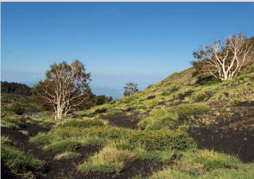
Erstes Grun im Abstieg vor dem Monte Corvo.

Von diesem Sattel folgen wir der hier beginnenden Ascherinne an ihrer linken Seite nach rechts abwarts. Im oberen Bereich der Rinne hat sich Eis unter dem Aschebelag gehalten. Kurz darauf halten wir uns an einem kleinen felsigen Kammrucken rechts von diesem und sausen nun auf der Aschebahn bequem ins Tal hinunter. Dabei mussen wir aufpassen, dass wir nicht uber den das Aschefeld rechts begrenzenden Kammrucken gelangen. Bald gesellen sich auch wieder die grunen Astragalus-Polster an den Randern zu uns und unsere Aschebahn vereint sich mit zwei von rechts herunterkommenden Rinnen. Die Ascherinne wird schmaler und flacher, bis sie schlielich in eine Schmelzwasserrinne, die gut an dem grauen ausgewaschenen Basalt zu erkennen ist, ubergeht. Von hier an steigen wir auf dem kleinen Rucken rechts der Rinne weiter hinunter und halten dabei auf den rotlich schimmernden Kraterkegel des Monte Corvo zu.