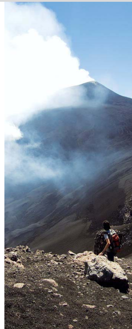
Der Hauptkrater uber dem Valle del Leone.

Links von uns erheben sich die Kraterkegel des Monte Sartorio, und – wieder im Birkenwald – stoen wir bald durch eine grune Eisenschranke auf die Zufahrtsstrae zum Rifugio Citelli, auf der wir nach rechts wieder unseren Ausgangspunkt erreichen. Wer nicht auf der Strae gehen mochte, verlasst diese auf ein rechts beginnendes Lavafeld und quert dieses ansteigend auf die gegenuberliegenden Birkenbaume zu. Dort trifft man durch eine Lucke in den Baumreihen auf die Strae und kommt nach rechts wieder zum Ausgangspunkt Rifugio Citelli zuruck.