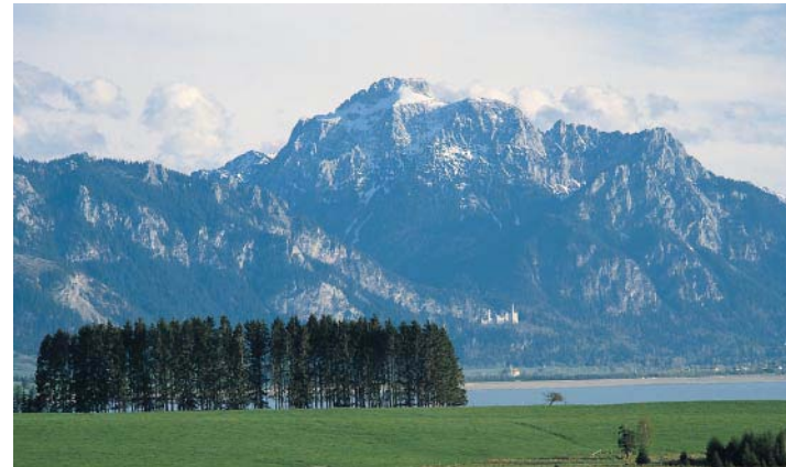
Feggensee, Schloss Neuschwanstein und Säulingmassiv.

Der Säuling, ein wuchtiger, völlig isoliert aufragender Felsberg, bildet das Wahrzeichen der Ostallgäuer Seenlandschaft. Er gehört zu den schönsten und markantesten Ammergauer Gipfeln, wird aber unsinnigerweise des Öfteren zu den Allgäuer Alpen gezählt. Zudem ist er eine Aussichtswarte ersten Ranges, liegen doch im Norden zu seinen Füßen all die Seen ausgebreitet. Die lange Zackenkronen des Pilgerschrofens formt die mächtige Westschulter des Säulings (siehe Variante).