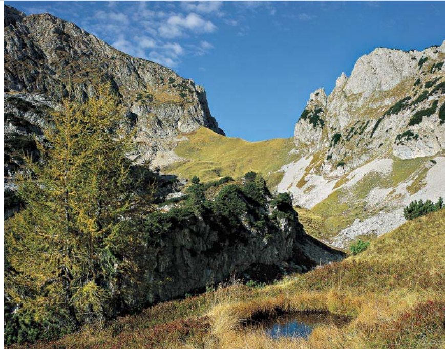
Der Hohe First (Scharte) mit Tagweide (links) und Schallwand (rechts).

Vor der Karalm auf einer Forststraße rechts in eine Senke hinab (Stoibanger), dann auf einem Steig (Weg Nr. 225) zu einer Wegverzweigung hinauf (Einmündung der Route 225a von Abtenau) und über einen Hochwalddrücken auf dem »Sommerweg« zum Sockel einer Felswand. An dieser geht es rechts entlang (drei kurze Drahtseilpassagen) und ein kurzes Stück noch im Wald zur freien Hangterrasse der