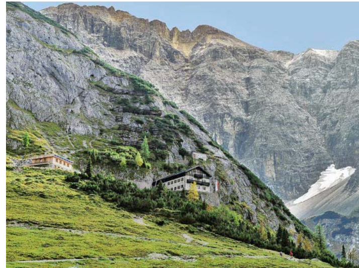
Das Karwendelhaus samt neu gebautem Winterraum (links) unter den Ödkarspitzen.

Um der monoton zu begehenden Forststraße ins Johannistal auszuweichen, wählen wir als Ausgangspunkt den Herzoglichen Alpenhof . Über Wiesen erreichen wir den Rißbach, den wir mittels einer Brücke überqueren. Jenseits verschwindet der markierte Pfad rasch im Wald und führt steil empor zu einem Wirtschaftsweg. Diesem folgen wir nach links bis zu seinem Ende und in der Folge wieder dem markierten Steig, einige etwas abschüssige Gräben querend, bis zur verfallenen Johannistalalm , von der man einen herrlichen Blick auf die jenseits des Tales steil emporragende Falkengruppe hat. In leichtem Abstieg ist bald die Fahrstraße im Johannistal erreicht, auf der wir nur kurz taleinwärts gehen, um dann einen abwechslungsreichen Pfad nahe der Straße bis in den Talhintergrund zu benutzen. So gelangen wir recht mühelos, zuletzt doch auf der Fahrstraße, zu den idyllischen Jagdhütten am Kleinen Ahornboden . Hier wenden wir uns westwärts, um durch das schwach ausgeprägte Filztal – den wuchtigen Aufbau der Birkkarspitze vor Augen – den breiten Hochalmsattel zu gewinnen. In wenigen Minuten steigen wir nun jenseits zum Karwendelhaus ab. Obgleich der Rückweg ins Rißtal problemlos am gleichen Tag zu bewältigen ist, sollten wir lieber in der gastlichen Hütte nächtigen, um anderntags die Birkkarspitze zu besteigen oder auch, ganz Auge und Ohr, gemütlich zur Falkenhütte zu schlendern.