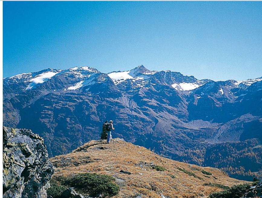
Auf dem Pederköpfl, Blick nach Osten, mit der Zufrittspitze als höchster Gipfel.

Varianten: 1) Von der Peder Alm kann man auch auf Weg 20 weiter talwärts Richtung Borromeohütte absteigen und dann auf Weg 6 zum Zufrittthaus gelangen. 1.30 Std. 2) Eine weitere Möglichkeit ist, zur Enzianhütte abzusteigen und von dort auf dem alten Militärsteig (»Multi-steig«) in schöner Wanderung zum Zufrittthaus zurückgelangen. 1.45 Std.