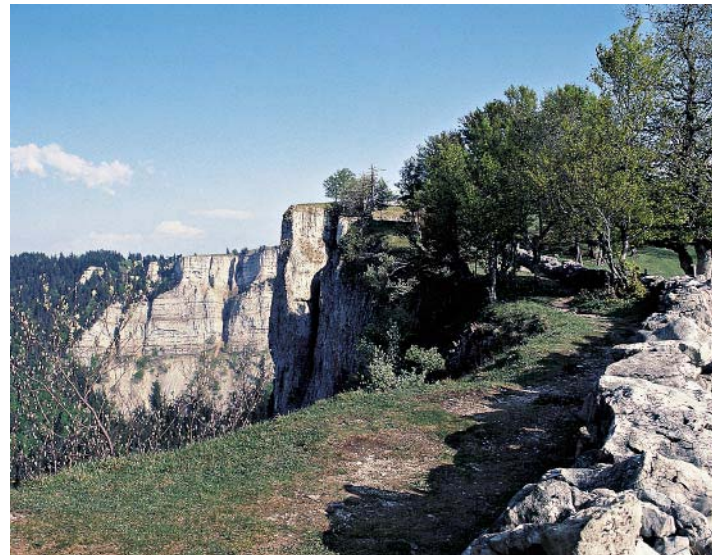
Vom Soliat fallen die Felswände 160 Meter tief in den Creux du Van ab.

Von der Ferme wandern wir nordwärts bis zum Felsgrat, der den Creux du Van gegen Norden abgrenzt und der als Le Dos d'Ane (Eselrücken) bekannt ist. Am Ansatz dieses Rückens beginnt der Zickzackweg »Chemin des 14 Contours«, der sehr steil den Wald hinabführt. Bei den Gebäuden von Les Oeuillons treffen wir auf eine Verzweigung. Hier hätten wir die Möglichkeit, direkt zur Ferme Robert zurückzuwandern und so die Tour abzukürzen. Wir bleiben jedoch auf dem gelb-rot markierten Weg und wandern nunmehr weniger steil ins Dörfchen Noiraigue . Dieser Name bedeutet »schwarzes Wasser«, denn bei Noiraigue tritt ein Flüsschen aus dem Fels, das sehr dunkel wirkendes Wasser führt. Seinen Ursprung hat der Bach in der oberhalb von Noiraigue gelegenen Ebene von Les Ponts-de-Martel. Am Rande dieses Hochmoors verschwindet der Bach in so genannten Dolinen und fließt dann unterirdisch nach Noiraigue, wo er wieder zutage tritt. In Noiraigue gehen wir unmittelbar nach Überschreiten der Bahngleise nach rechts und dringen sogleich in die immer enger werdende Schlucht der Areuse vor. Bald treffen wir auf die Brücke, die wir zu Beginn der Tour benutzt haben und wandern auf nunmehr bekanntem Weg nach Champ du Moulin zurück.