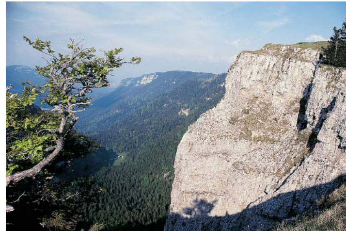
Im kalksteinernen Amphitheater des Creux du Van leben sogar Steinböcke.

Tipp: Empfehlenswert in der Region ist der Besuch der Asphaltminen von La Presta bei Travers. Hier wurde von 1712 bis 1986 Asphalt abgebaut und heute erinnert ein interessantes Museum an den harten Alltag der Minenarbeiter und die Geschichte des Asphaltabbaus. Nähere Informationen unter www.gout-region.ch .