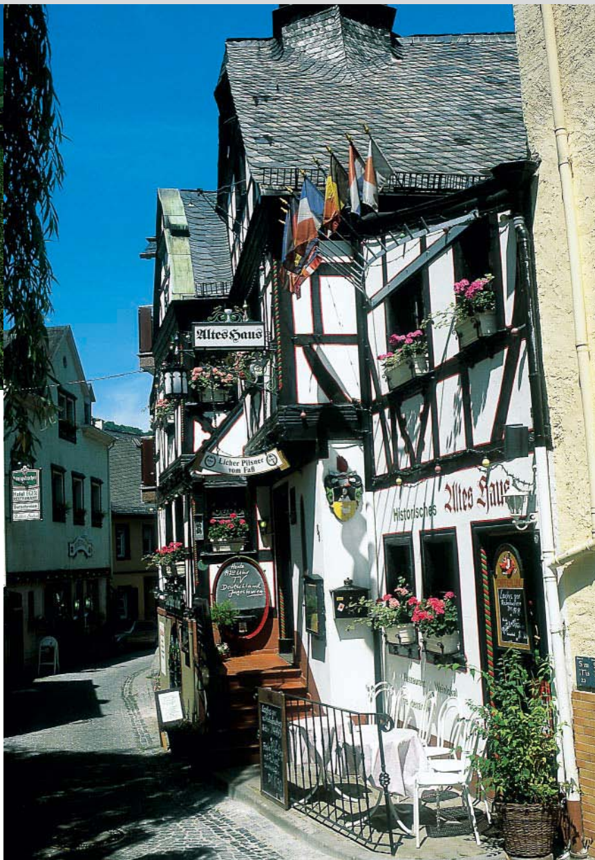
Bild oben: Am Assmannshäuser Höllenberg gedeiht der beste Spätburgunder. Bild rechts: Historische Weinstube: das Alte Haus in Assmannshausen.

Zwei Wegkehren oberhalb passiert Kelch den Bingerlochblick , quert die Weinlage Frankenthal und gelangt auf 200 Stufen hinab in den schmucken Winzerort Assmannshausen . Reich verzierte Fachwerkhäuser, enge Gassen und Stimmungslokale prägen den bekannten Heimatort des Spätburgunders.