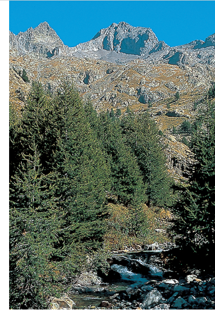
Cime du Gelas.

Nach guten 5 Minuten verläuft der Pfad schräg rechts ansteigend, entlang eines Felsenmassivs linker Hand. Wir erreichen den Collet du Lac de Fenestre ; genau nördlich davon ist der Pas du St-Robert (der Gipfel des St-Robert ist östlich davon, und noch weiter östlich der Collet St-Robert). Weiter geht's auf dem mit Steinmännchen markierten Pfad zu den großen Felsblöcken, die unmittelbar südlich an den Lac Mort (2527 m) grenzen. Die Spur verläuft einige Meter südlich des Sees, geht etwas bergab und steigt dann wieder an (lang gezogene gelbe Markierungen). Auf etwa 2600 m