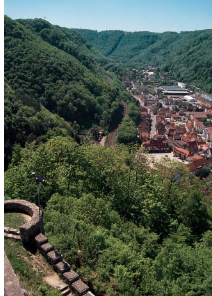
Geislingen an der Steige vom Aussichtsturm der Ruine Helfenstein.

Richtung »Geislingen/Steige« geht's weiter am Trauf entlang, dem gelben Dreieck folgend, zum Ostlandkreuz auf der Schildwacht , das den Toten Südmährens der beiden Weltkriege gewidmet ist. Nach einem letzten informativen Stadt-Tiefblick geht es auf dem markierten Wanderweg in weiten Kehren und weiter unten zwei Straßenkurven abkürzend wieder zurück nach Geislingen .