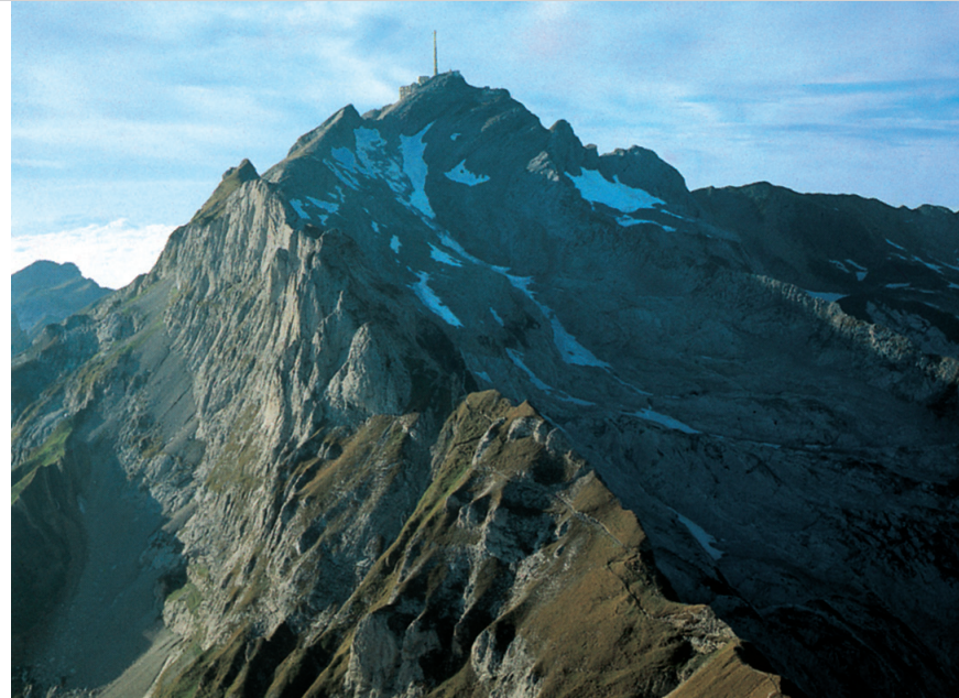
Der Lisengrat mit dem Säntis im Hintergrund.

Variante: Aufstieg zum Altmann, 2435 m, durch die Fliswand zum Altmannsattel; stellenweise gesichert, am Gipfel leichte Kletterei; vom Rotsteinpass ca. 1 Std.; siehe Tour 35 bzw. 50.