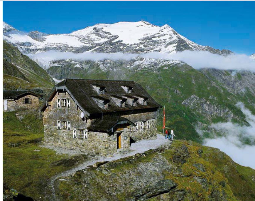
Naturfreundehaus-Neubau und Hocharn.

Im Talkessel von Kolm-Saigurn werden bis in unsere Zeit nicht nur staunenswerte Mineralienschatze gefunden, hier wurde bereits vor 4000 Jahren das Tauerngold entdeckt. Hier besteht in der Zimmererhütte, einem ehemaligen Knappenhaus, eine besuchenswerte Nationalpark-Infostelle, deren Thematik im Talmuseum von Rauris ergänzt wird. Kolm-Saigurn, der Ort mit dem fremd klingenden Doppelnamen, wurde vor rund 1300 Jahren von den Slawen gegründet. Sein Name leitet sich vom mundartlichen »Kolm« (Kolben, die in den Pochwerken eingebaut waren) und »saigurn« (Erz schlemmen, reinigen) her. Auf dem Naturfreundeweg von Kolm-Saigurn zum Naturfreundehaus-Neubau erhalten wir den besten Überblick über den Bergkessel. Der anschließende Tauerngold-Rundwanderweg führt uns in Verbindung mit dem Gletscherschaupfad an ehemaligen Stationen des Goldbergbaus sowie am Gletschertor des Vogelmaier-Ochsenkar-Keeses (Goldberggletscher) vorbei und verdeutlicht uns den Gletscherrückgang seit 1850.