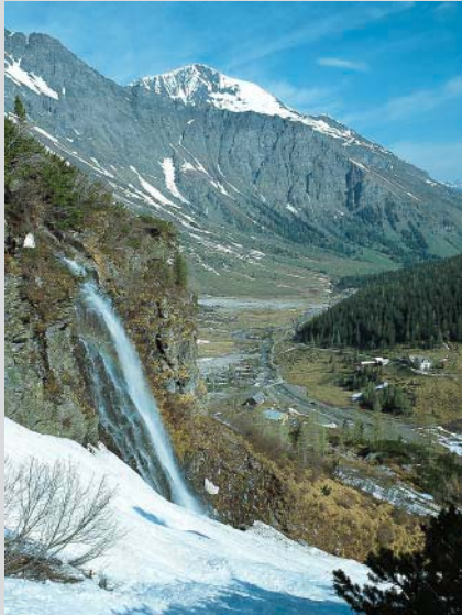
Kessel von Kolm-Saigurn mit Barbarafall.