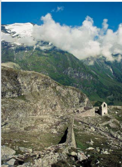
Schrägaufzug und Radhaus.

Rechts vom Neubau gehen wir am Eingang des Augustinstollens vorbei und dann leicht fallend zum Bruchhof und zur Ruine des Radhauses , der Bergstation eines 1500 m langen Schrägaufzuges weiter. Von dort steigen wir zu einer Weggabelung und rechts zu einem Steg an, wo der Gletscherschautafel mit mehreren Schautafeln beginnt. Entlang des Gletscherbaches wandern wir über den Obermayer-Felsen (2275 m) zum Fuß des Rojacher Riedel , dem höchsten Punkt des Rundweges hinauf. Nun steigen wir zum Gletschersee ( Gletschertor des Vogelmaier-Ochsenkarkeeses) und am schäumenden Bach entlang zu einem Steg ab. Jenseits des Gewässers gelangen wir über eine Randmoräne und Abraumhalden zur Ruine des Knappenhauses , dem einstigen Wohn- und Wirtschaftsgebäude der Bergknappen. Die Trasse einer horizontalen Schlepplift führt uns zum Bremserhäusl (oberste Stelle des Schrägaufzuges, Umladestelle für Golderz und Versorgungsgüter), von dem es in Serpentina zum Neubau hinabgeht.