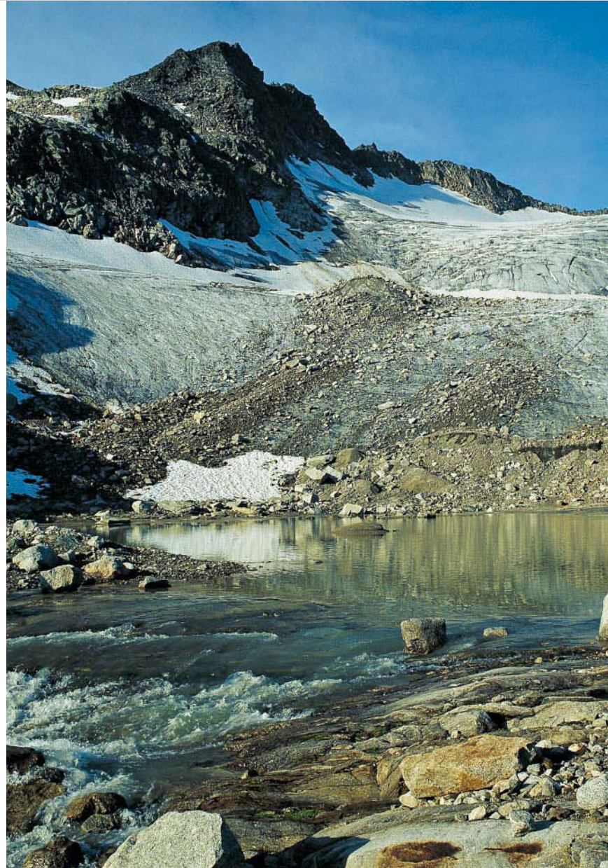
Rechts: Am Gletschersee.

Für den Abstieg nach Kolm-Saigurn schlagen wir den Weg Nr. 122 über den Barbarafall vor. Dieser zweigt kurz unter der Hütte von unserer Aufstiegsroute links ab, orientiert sich zunächst an großen Steinmännern und zieht sich dann als ausgetretener Pfad nach Kolm-Saigurn . Von dort geht es auf der Straße zum Lenzanger hinaus.