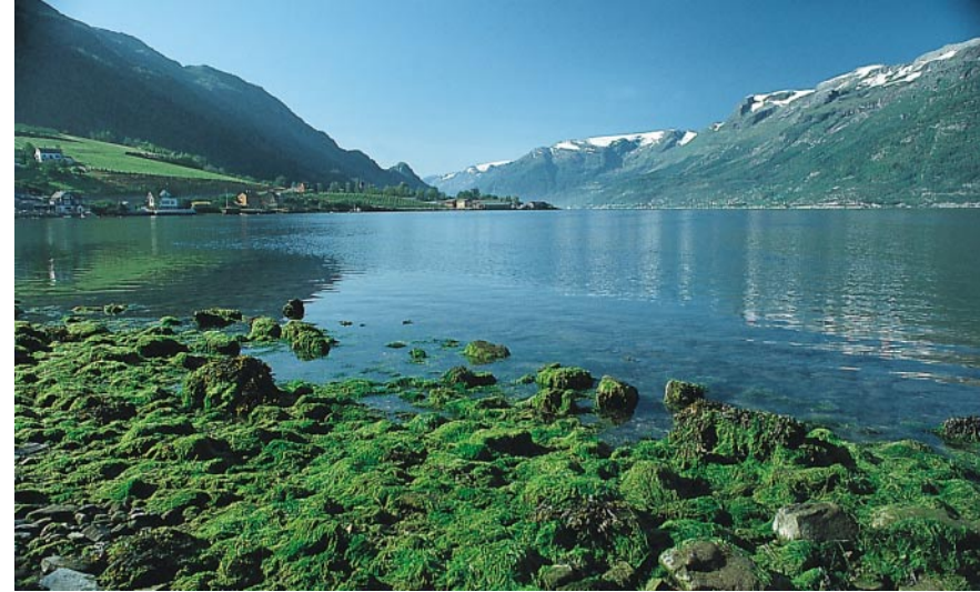
Der Sørfjord zwischen der Hardangervidda und der Folgefonna-Halbinsel.

Ausgangspunkt: Eingang des Lofthus Campings (100 m) in Lofthus am Sørfjord,