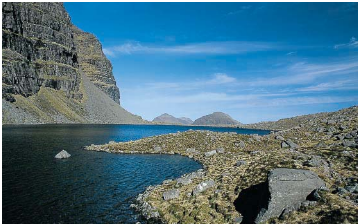
Im Coire Mhic Fhearchair.