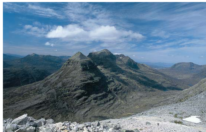
Der Liathach, vom Westgipfel des Beinn Eighe, dem Sail Mhor, aus gesehen.

auf dem zentralen Gipfel des Beinn Eighe, dem Spidean Coire nan Clach . Vom markierten Triangulationspunkt (972 m) wenden wir uns nach Süden in Richtung eines etwas niedrigeren Nebengipfels. Von dort steigen wir durch das Coire an Laoigh auf einem gut ausgebauten Pfad zurück ins Glen Torridon. An der Straße angekommen informieren uns Schilder des National Trust über den Beinn Eighe und dessen Umgebung. Um zurück zum Auto zu gelangen, müssen wir noch einige Kilometer parallel zur Straße zum Ausgangspunkt zurück wandern. Glücklicherweise findet eine Mitfahrgelegenheit!