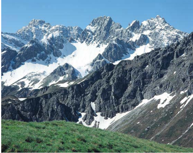
Unter dem Fellhorn, Blick auf die Hammerspitzen.

bahn nach Riezlern im Kleinwalsertal; von dort erreicht man mit dem Bus rasch wieder die Talstation der Söllereckbahn.