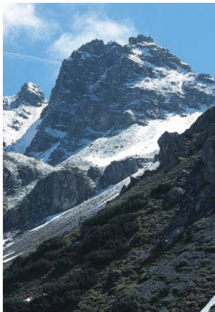
Rossgundkopf vom Weg vom Fellhorn zur Kühgundalpe.

Seilbahn auf das Fellhorn). Beim Weiterweg zum Fiderepass mit seiner sehr schön auf den Matten gelegenen Hütte wandert man dann durch eine Landschaft ganz anderer Art mit Weideflächen, Latschen und einer ganz nahen und wilden Felskulisse, in der vor allem die Hammerspitzen (2258 m) imponieren. Bei sich verschlechternden Verhältnissen gibt es gleich zwei bequeme Möglichkeiten für eine Flucht: Talfahrt mit der Fellhornbahn ins Stillachtal oder nach einem kurzen Anstieg vom Gundsattel mit der Kanzelwand-