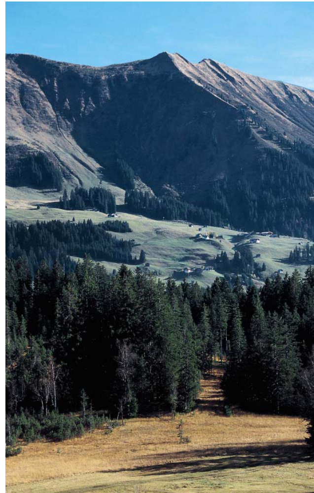
Fellhornkamm über dem Kleinwalsertal.